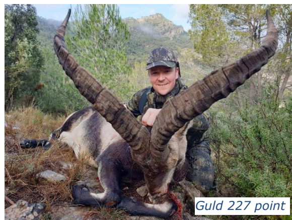
Guld 227 point