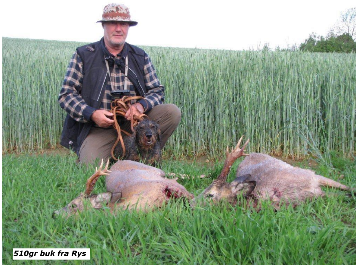
510gr buk fra Rys