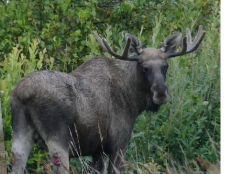
KARGAPOIYE RUSSIA AND 2018