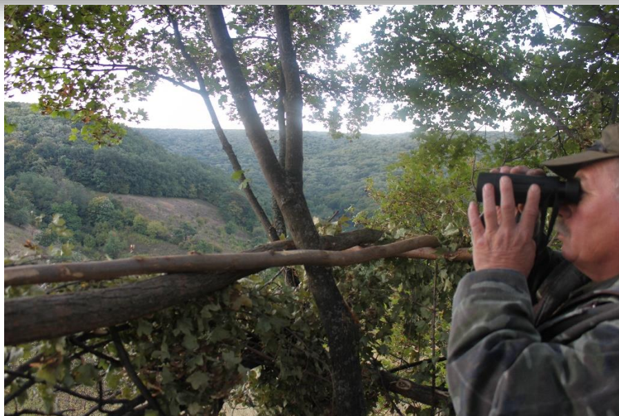
Gamekeeper & Buhls Jagtrejser • Vejlevej 274 • DK-7323 Give tlf: +45 97267418 • +45 76704100 • e-mail: info@buhlsjagtrejser.dk